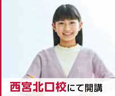
西宮北口校にて開講

将来の高校受験を見据え、学年域を超えた先取り指導と発展的な学習で、 ハイレベルな学力を養成していきます。